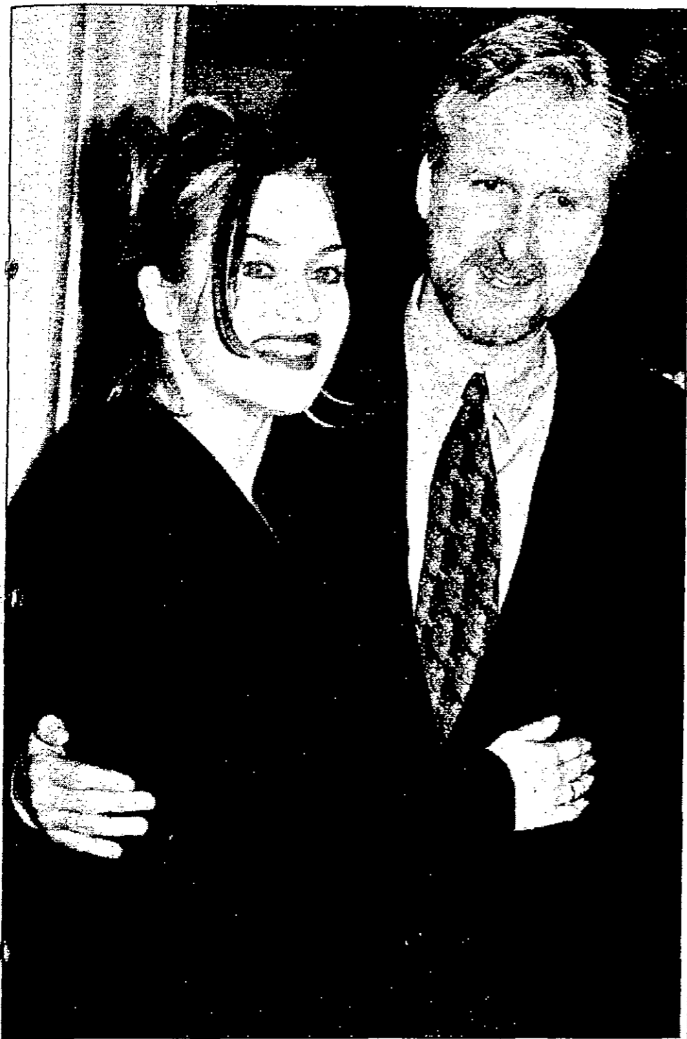
بطلة فيلم «تلاتينك» كايت ويسيلت حضرت بصحبة المخرج جيمس كامرون، حفل جمعية الفنون في لوس أنجلوس إسبانيا، والذي اختير فيه الفيلم كأفضل مخرج